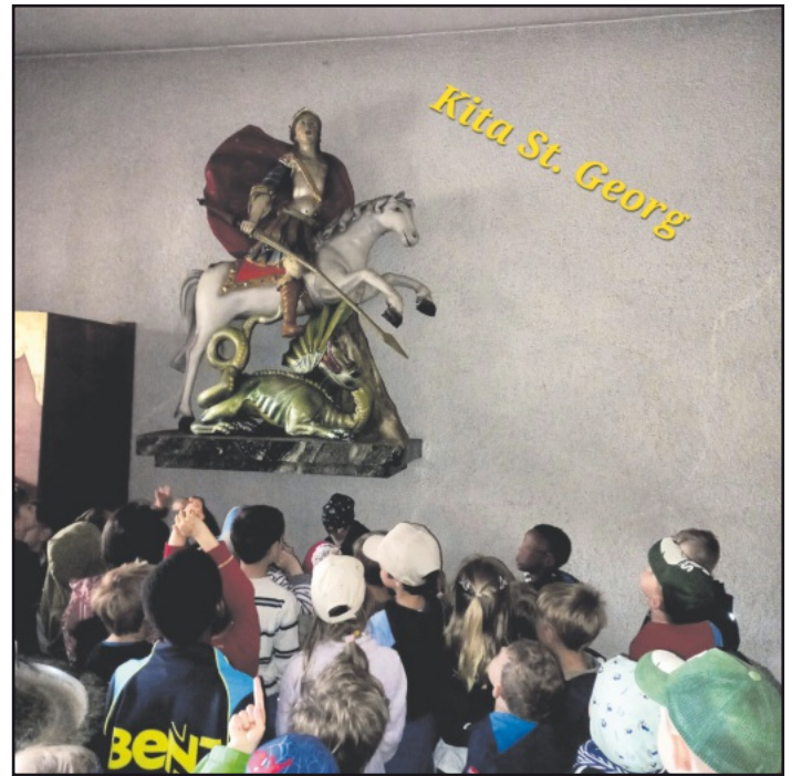
Die Kita-Kinder besuchen den Heiligen St.Georg

Auf dem Rückweg mussten wir natürlich über den Rathausplatz gehen, wo gerade das Ketten- Karussell aufgebaut wurde und so bei vielen Kindern die Vorfreude auf das Jörgenfest am Wochenende nochmal gestiegen ist.