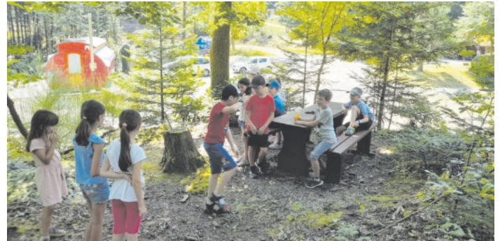
Jeder Unterschlupf wurde vorgestellt

Natürlich ging es auch nach draußen. Wir wanderten auf die Barrack und bauten tolle Unterkünfte, sprangen ins Wasser an der Klingelhalde und bauten Boote mit Korken. Auch Schulfhofspiele standen auf dem Programm. Der Abschluss der ersten Woche bildete der Farbertag am Freitag, an dem Alle in einer Farbe angezogen kamen und auch das Essen in der entsprechenden Farbe mitgebracht wurde. Das hat uns sehr viel Spaß gemacht.