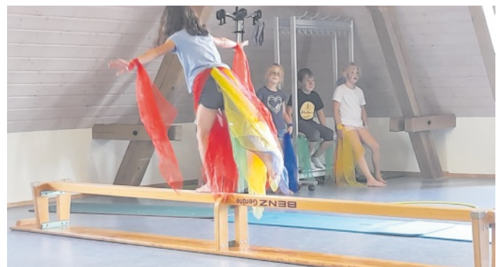
Auch die Zirkusvorstellung stand unter dem Motto "Huhn"

Die zweite Woche stand unter dem Motto „Huhn und Ei“ und es gab viel zu Erleben. Die Kinder luden uns Betreuerinnen zu einer Zirkusvorstellung ein mit tollen Akrobaten und Clowns. Wir bastelten und bauten Hühner in vielen Variationen, lernten viel über Hühner, besuchten das Hühnermobil und den Seger Hof und konnten unsere selbst eingesammelten Eier in Form von Spätzlen vertilgen. Der Freitag stand unter dem Motto „Umzug“, weil unsere Möbel aus den alten Räumen der verlässlichen Grundschule den Weg in den neuen Raum gefunden hatten. In der dritten Betreuungswoche hatten die Kinder großen Spaß an Modenschauen, wir erneuerten die Buchstabschlange auf dem Schulhof, gestalteten mit Farben und gönnten uns beim „Ausflug mit Eis“ die leckere Köstlichkeit.