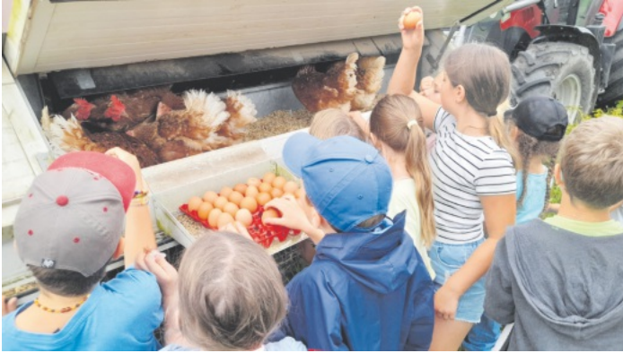
Eier sammeln im Hühnermobil