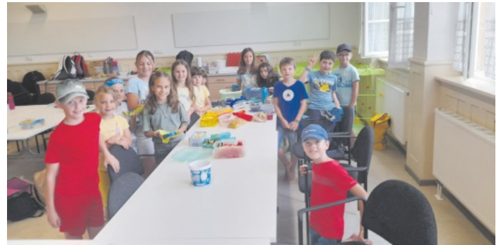
Essen nach Farben - lecker!

Die zweite Woche stand unter dem Motto „Huhn und Ei“ und es gab viel zu Erleben. Die Kinder luden uns Betreuerinnen zu einer Zirkusvorstellung ein mit tollen Akrobaten und Clowns. Wir bastelten und bauten Hühner in vielen Variationen, lernten viel über Hühner, besuchten das Hühnermobil und den Seger Hof und konnten unsere selbst eingesammelten Eier in Form von Spätzlen vertilgen. Der Freitag stand unter dem Motto „Umzug“, weil unsere Möbel aus den alten Räumen der verlässlichen Grundschule den Weg in den neuen Raum gefunden hatten. In der dritten Betreuungswoche hatten die Kinder großen Spaß an Modenschauen, wir erneuerten die Buchstabschlange auf dem Schulhof, gestalteten mit Farben und gönnten uns beim „Ausflug mit Eis“ die leckere Köstlichkeit.