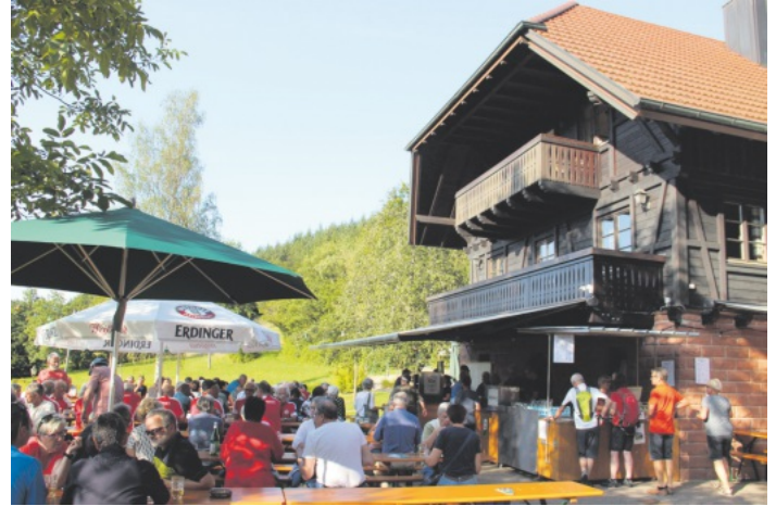
Hier darf die Seele baumeln.