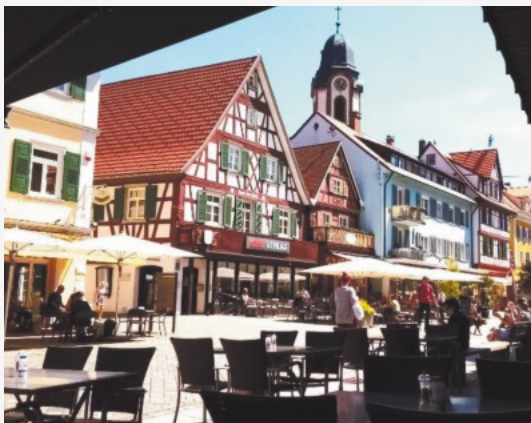
Die Heimat hat schöne Plätze: Rast in Oberkirch

Gerne können auch Sie uns von Ihren Fahrradtouren, Fahrradausflügen oder sonstigen STADTRADELN-Aktionen Fotos zusenden (an christiane.kranz@berghaupten.de ), welche wir in unserem Amtsblatt veröffentlichen.