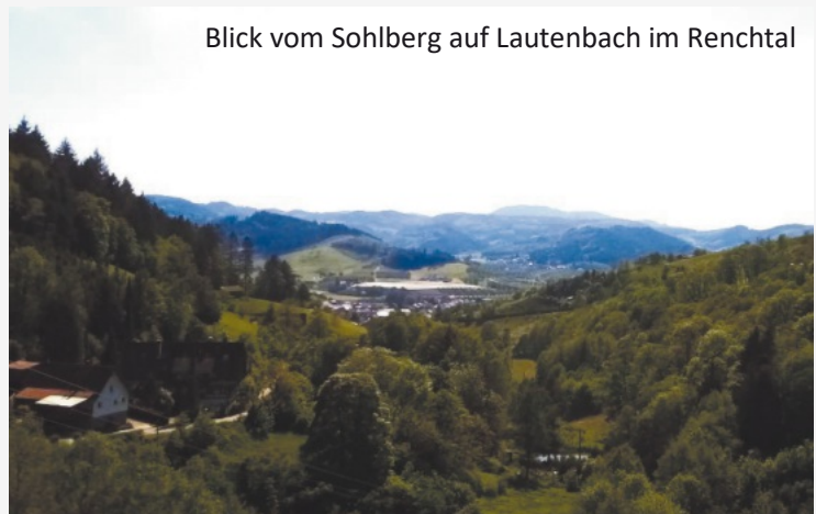
Blick vom Sohlberg auf Lautenbach im Renchtal