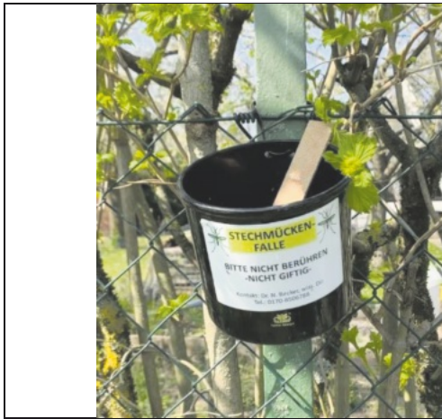
Abbildung 1: Eiablagefalle mit Eiablagestäbchen

Um die Verbreitung der Asiatischen Tigermücke festzustellen, wird ein sogenanntes Monitoring im Befallsgebiet und im Umfeld durchgeführt. Dazu werden Eiablagefallen in Form von Wasser gefüllten schwarzen Kunststoffbechern mit einem Holzstäbchen in Siedlungsgebieten aufgehängt und regelmäßig kontrolliert (Abb.1).